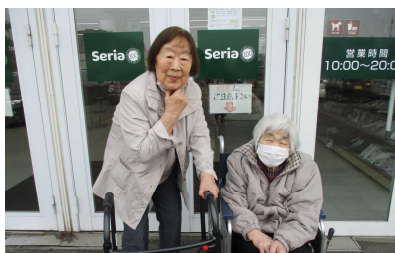
外出レク(お買い物に行きました)