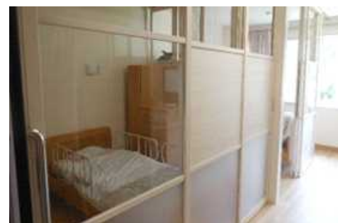
↑改修工事後の居室の様子